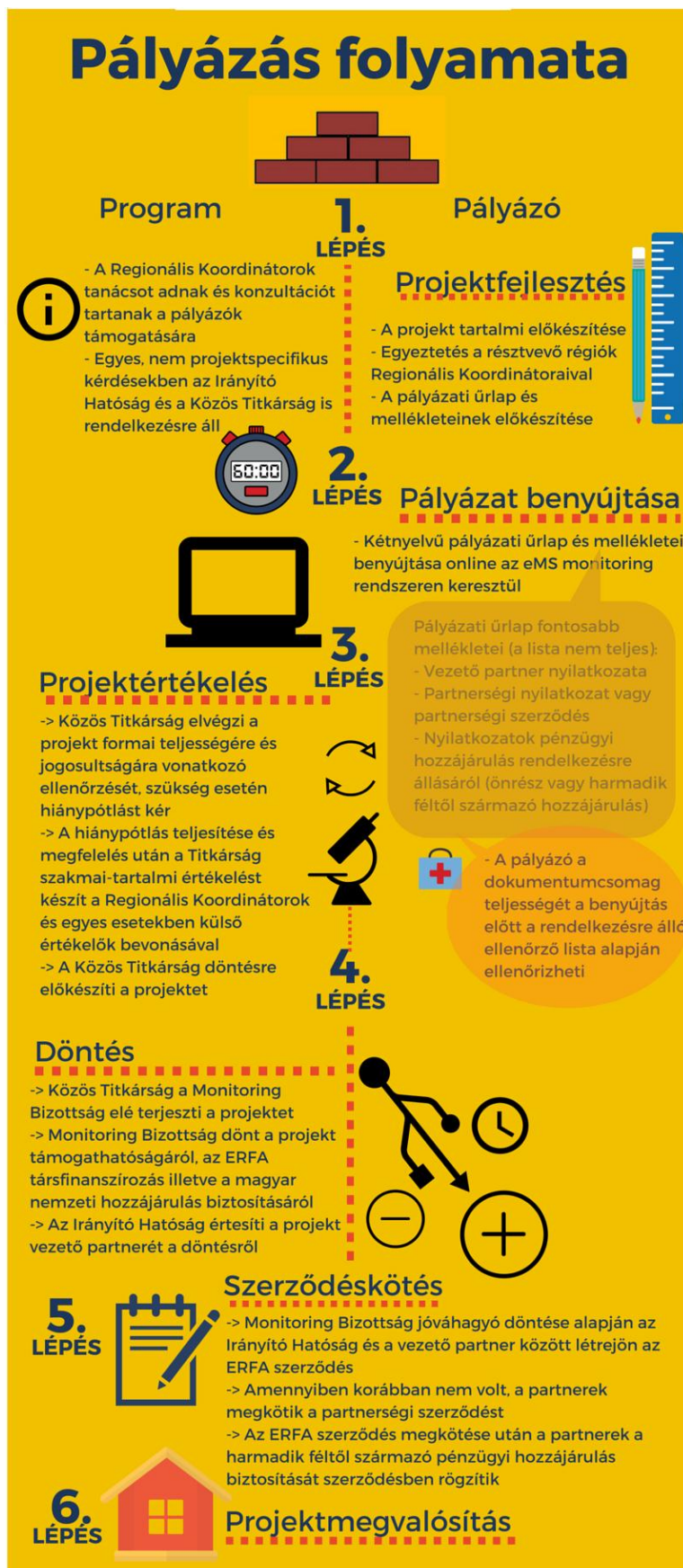
4. ábra A pályázás folyamata

Az Interreg V-A Ausztria-Magyarország programban a pályázatok benyújtására a programidőszak során folyamatosan van lehetőség, vagyis nincsenek kötött pályázatbenyújtási határidők. A beérkezett pályázatokat a Monitoring Bizottság bírálja el, mely évente kb. két alkalommal tartja üléseit. Hogy elegendő idő álljon rendelkezésre a döntés-előkészítéshez, csak azok a projektek kerülnek a Monitoring Bizottság hoz előterjesztésre, amelyek a bizottság ülését megelőzően 10 héttel beérkeznek a Közös Titkárságra. Az ezt követően beérkezett pályázatok a Monitoring Bizottság következő ülésén kerülnek tárgyalásra. A Monitoring Bizottság soron következő üléséről a Program honlapján tájékozódhat.